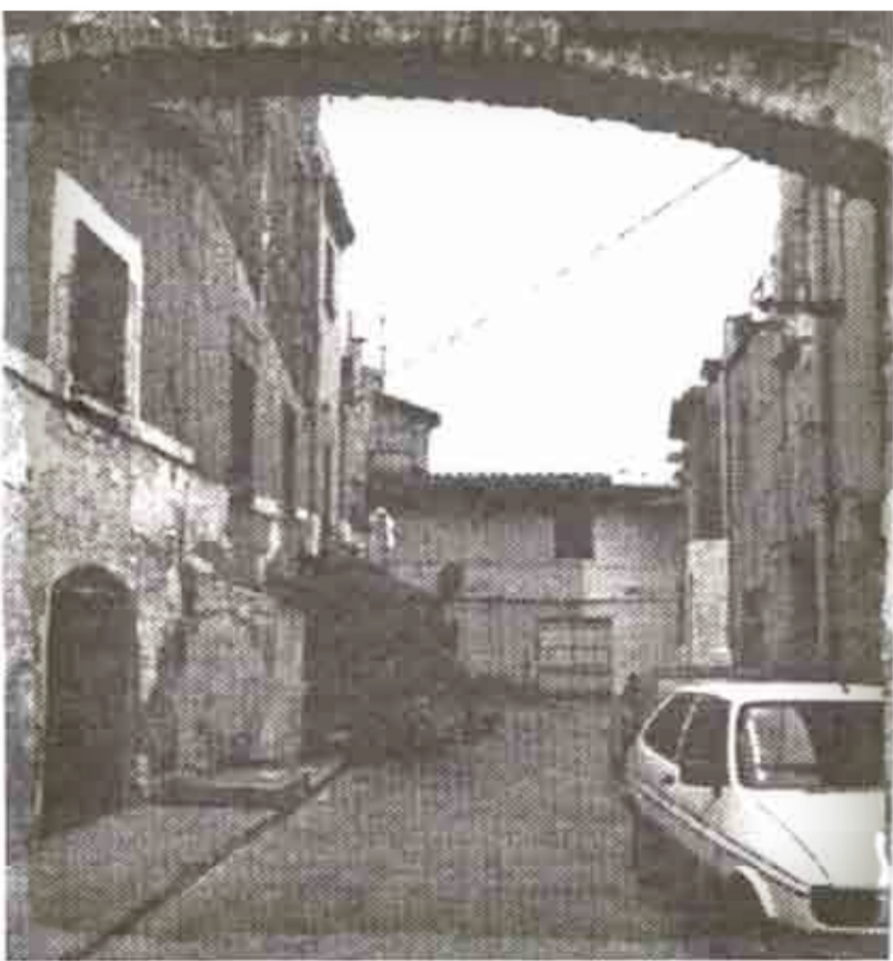
entrada a la masia de Can Blanc de les Eres foto Museu.

El 20 de Juny de 1682, Eulàlia Anglada, vídua de Pere Anglada, va vendre al ciutadà honorat de Barcelona i doctor en Medicina, En Jacint Blanch, tot aquell tros de terra anomenada les "Eres de la Sagrera". Hi fou construïda una casa que confrontava amb el camí que va des del carrer de les Eres, al camí de la Plaça.