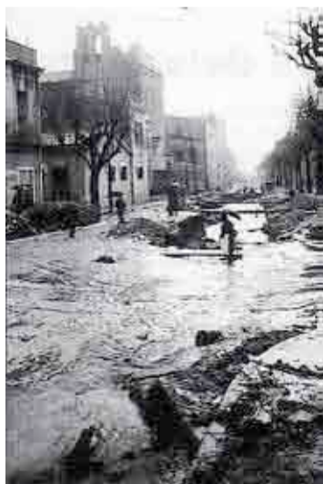
Av. Martí Pujol anys 50-60

Amb les pluges la cruïlla de la riera de Martí Pujol amb els carrers Barcelona i Rector es tornen en llocs de difícil pas pels vianants.