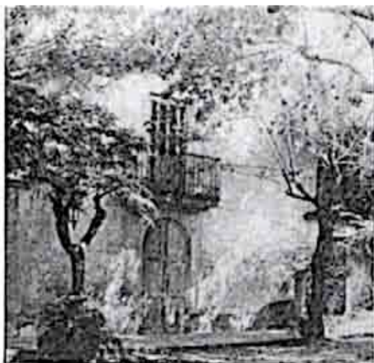
Façana de la Masia al 1930 Museu Municipal

La masia de Can Casals o Can Casas esta situada a la cantonada del c/ de Barcelona amb Sant Sebastià, al nº 53 ( abans nº9 ). Fou construïda al segle XVIII com un Mas tradicional dins Dalt de la Vila, i un temps després li foren afegides dues petites cases en filera. El propietari era de Tiana, qui més tard la vengué a un prevere de Barcelona.