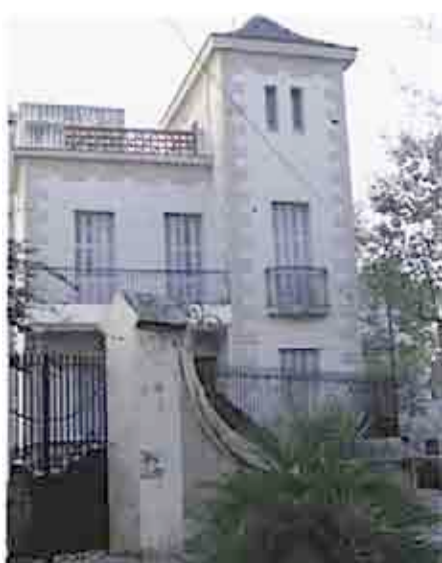
Entrada de Can Casas per el carrer de Barcelona i Martí Pujol

Durant el 1882 les dues cases dels números 48 i 50, senzilles i pageses, varen ser comprades per en Francesc - Xavier Casas i Planes -un indiano que havia tornat amb fortuna de les amèriques- i les va reconstruir en un sol i magnífic edifici remarcant les obertures exteriors amb unes línies clàssiques decadents, per ser la vivenda de tota la seva família. Al llindar la dècada de 1930 els hereus de la família posen la casa a lloguer i durant uns anys fou la seu d'una Clínica i els serveis complementaris a la mateixa.