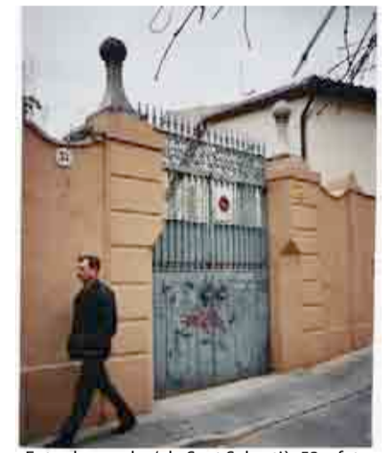
Entrada per el c/.de Sant Sebastià .53

La masia va arribar a tenir la teulada totalment malmesa pel pas del temps, i a causa d'unes pluges severes va arribar quasi a l'ensorrament total; sortosament els propietaris varen fer-hi una molt correcta restauració.