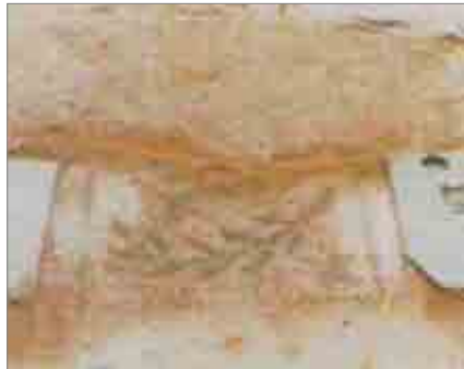
Mosaic de tesa-les florals de la Casa de les Heures

Com era d'esperar en aquest sector, durant l'excavació es va descobrir l'existència d'un carrer, en direcció mar a muntanya i dues cases a cada costat.