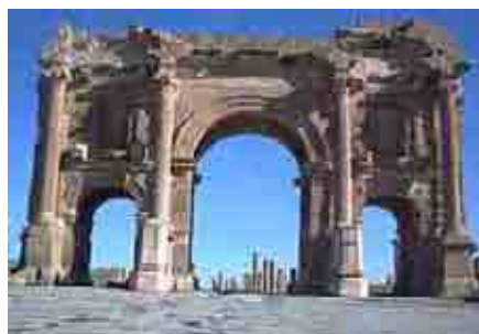
Puerta de timgad Argelia