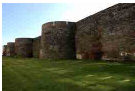
Murallas romanas de Lugo España

La termas fueron uno de los edificios públicos más populares y más importantes del Mundo romano. Los habitantes de las insulte manzanas de casas de las grandes ciudades, no tenían posibilidad de lavarse en su casa por falta de agua corriente y por este motivo a partir del siglo II a.C, se crearon las termas o baños públicos. A las termas se iba, principalmente, por motivos higiénicos y de salud, pero también era un lugar apropiado para encontrarse con los amigos, para hacer tertulia e incluso para instruirse. Las termas tenían un carácter democrático y todo el mundo tenía el acceso Permitido a ellas, ricos y pobres jóvenes y viejos, libertos y esclavos, hombres y mujeres, ya que el precio de la entrada era muy económico pues costaba menos que una Barra de pan o un litro de vino, y era gratuito para los soldados, los niños y los jóvenes. Hasta los diecisiete años. Con el fin de que no coincidieran los hombres y las mujeres, Existían horarios distintos, de 10 a 13 para las mujeres y de 13 a 22 o más tarde para los hombres