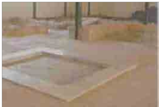
Casa Domus o dels DOFINS. Amb grans