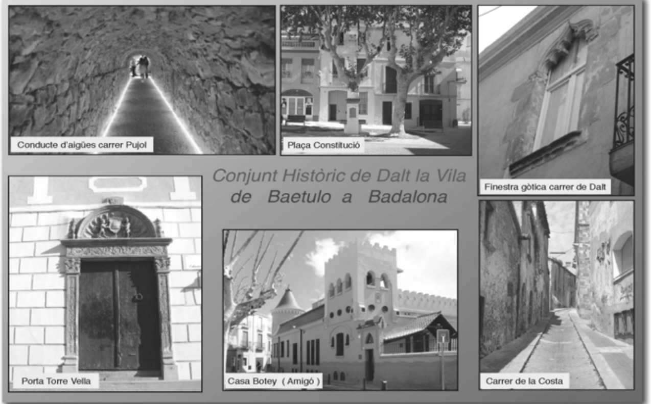
Conjunt Històric de Dalt la Vila de Baetulo a Badalona

El gaudi de fer-hi un tomb ens permet descobrir la casa dels dofins, un antic safareig, un pou, façanes esgrafiades, badius, atzucacs, el carrer més estret de Badalona, la porta renaixentista de la Torre Vella o la modernista Casa Botey. I envoltats de la quietud d'un petit poble dins d'una gran ciutat.