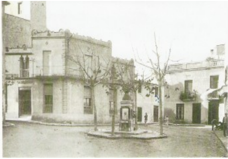
Plaça de la Constitució des de la plaça de la Font al 1930

La Plaça de la Constitució és sens dubte la plaça més antiga de la nostra ciutat. El 1112, es construïren les primeres cases a l'entorn de l'església de Santa Maria, i foren l'inici del seu perímetre. Al 1740 l'anomenaven Plaça de Badalona i l'any 1821 se li va canviar el nom per el que té actualment.