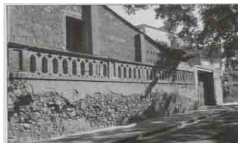
Antic escorxador al c/ Quintana Alta,40 que va funcionar fins 1927, després fou el preventori i les oficines i magatzem per la brigada Municipal

FARMÀCIA Goizens Av. Martí Pujol 230-246 (08911) Badalona Tel 93 384 47 54 Fax 93 384 52 43