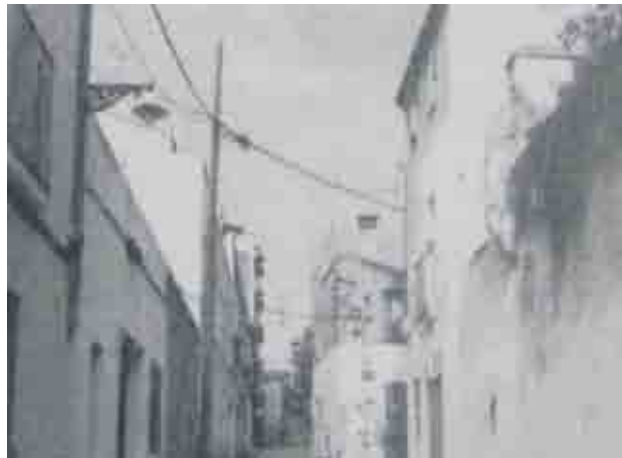
Carrer de la Quintana Alta

Una taberna molt freqüentada estava instal·lada a Ca'l Pino, formant cantonada amb el carrer Vallmajor, aquest casalot va ser enderrocat i de nou construït a finals de 1998.