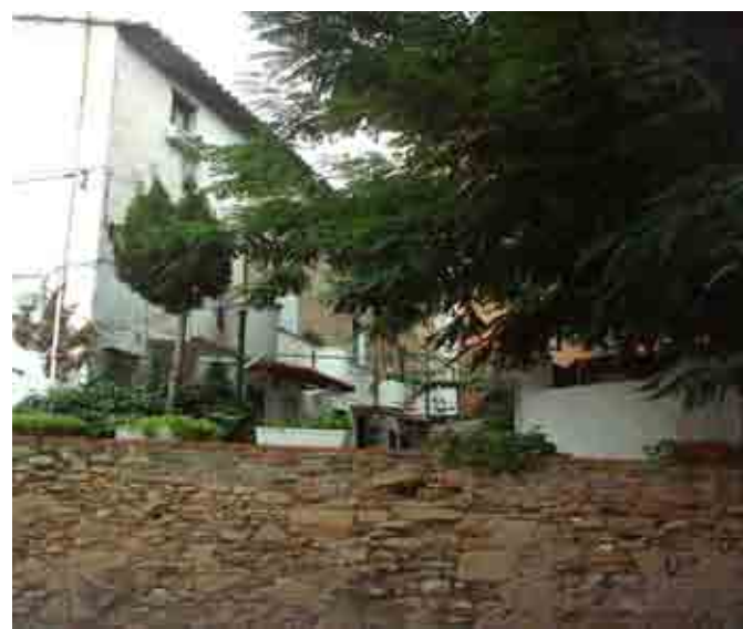
Las cases del Pou característiques de Dalt de la Vila.

Enfront de les "cases del Pou" a l'altre costat del carrer, existia un carreró amb varies cases de la mateixa època que varen ser enderrocades a l'any 2000 per la construcció de noves vivendes.