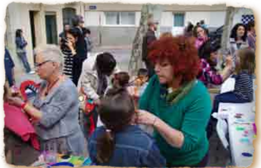
MAQUILLANT ELS PETITS