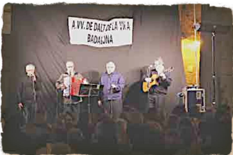
HAVANERES I ROM CREMAT PER A TOTHOM