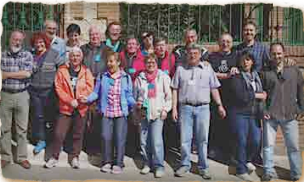
L'EQUIP DE LES FESTES DE MAIG