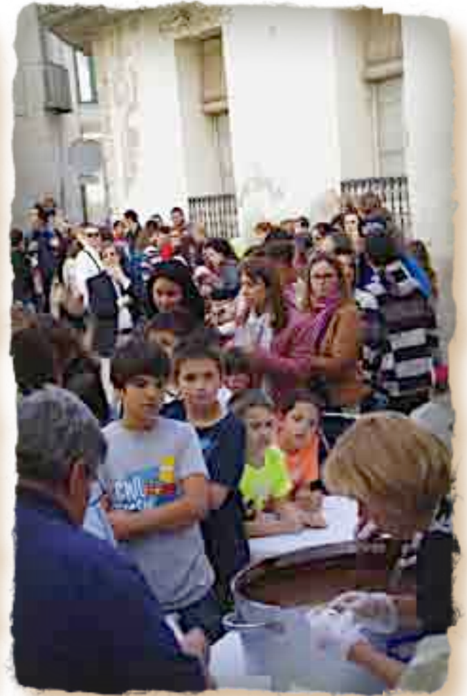
XOCOLATADA PELS PETITS