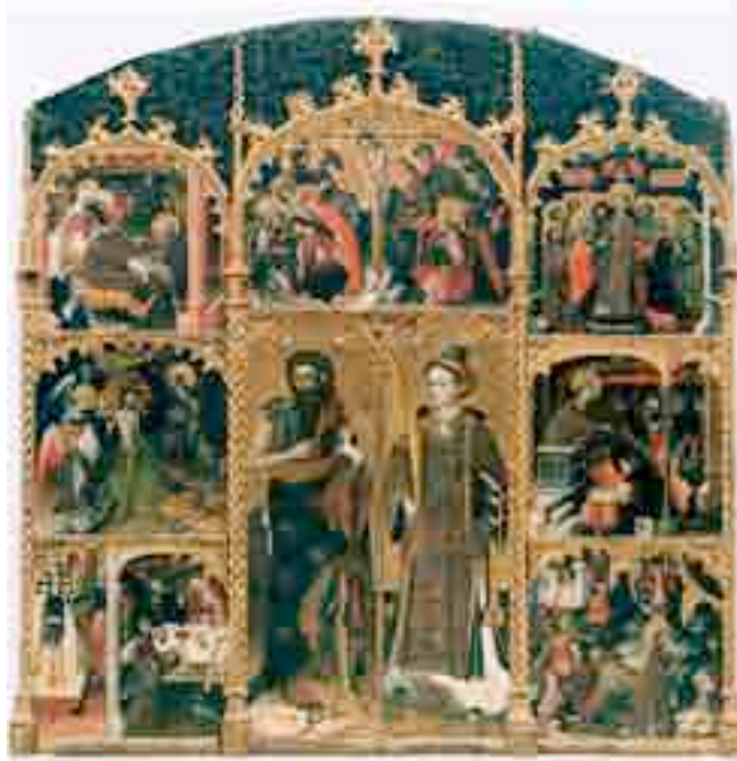
Retaule de Sant Esteve i Sant Joan del mestre de Badalona

Al primer terç del s.XV, pestes i guerres havien delmat els feligresos de Santa