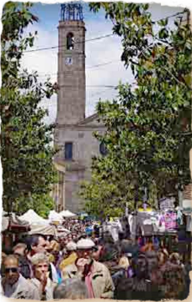
EL CARRER DEL TEMPLE PLE DE GENT A VESSAR