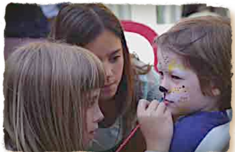
AQUEST JOVENT SÓN UNS ARTISTES